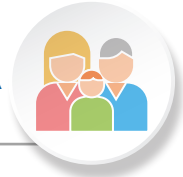
Figura 1. Adaptado de “Informe anticipando: Medicina Preventiva Personalizada” Fundación Instituto Roche.